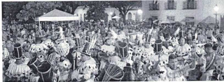
O PRÉ-CARNAVAL SEGUE NOS FINS DE SEMANA DE FEVEREIRO ATÉ O DIA 24, QUE É O ÚLTIMO DOMINGO ANTES DO CARNAVAL 2019

O final de semana na capital foi cheio de ritmos, cores, alegria e muita folia com blocos, escolas, dentre outros brincadeiras carnavalescas. A festa já começou na sexta-feira com a largada oficial do período pré-carnavalesco do Governo do Estado, por meio da Secretaria de Estado de Cultura e Turismo (Sectur), com uma programação na Praça Nauru Machado, que ficou repleta de gente no primeiro dia do circuito oficial da folia. As prévias acontecerão durante todas as sextas-feiras e fins de semanas que antecedem a Folia de Momo.