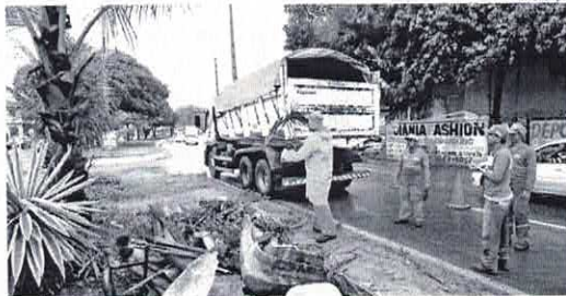
PREFEITURA RECOLHE DIARIAMENTE 1.300 TONELADAS DE LIXO NA CAPITAL