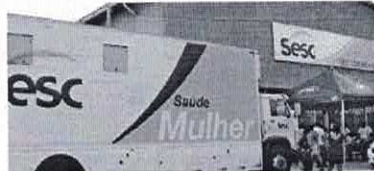
CAXIAS, SÃO LUÍS E PAÇO DO LUMIAR FAZEM PARTE DA AÇÃO

O câncer é a segunda causa de morte no mundo. Estimativa do Instituto Nacional do Câncer (Inca) aponta a ocorrência de cerca de 600 mil casos novos de câncer no Brasil entre 2016 e 2017, dos quais cerca de 180 mil foram de pele não-melanoma, 61 mil cânceres de próstata em homens e 58 mil casos de câncer de mama em mulheres.