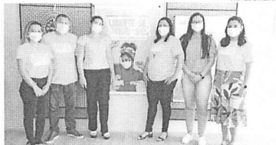
LANÇAMENTO ACONTECEU NA PRAÇA MESTRE ANTÔNIO VIEIRA, NO MONTE CASTELO

O lançamento aconteceu na Praça Mestre Antônio Vieira, no bairro do Monte Castelo, em São Luís, e ofereceu vários serviços como avaliação e orientação psicológica; atendimento da Farmácia Viva; verificação de glicemia e pressão arterial; testes rápidos de HIV/Sífilis e Hepatite; Testagem para Covid-19; ginástica laboral; atividade funcional; tai chi chuan; e exposição de oficinas terapêuticas do Centro