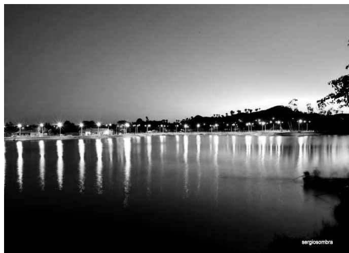
ORLA DO AÇUDE MUNICIPAL