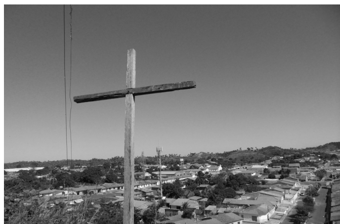
VISTA DO MORRO DO CRUZEIRO