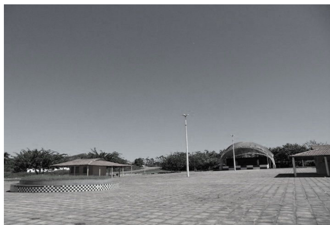
Praça de Eventos